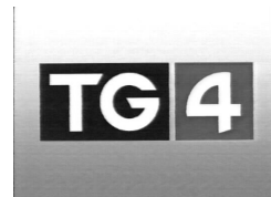
Bunaithe ar alt ar an iris idirlín www.Beo.ie