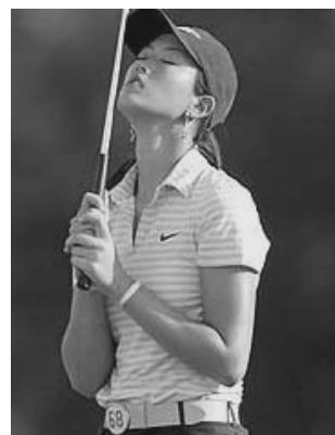
Bunaithe ar alt sa nuachtán Foinse