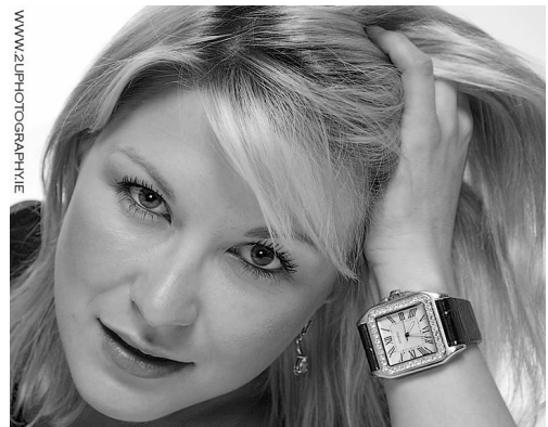
Bunaithe ar alt le hAlan Desmond ar an iris idirlín www.beo.ie