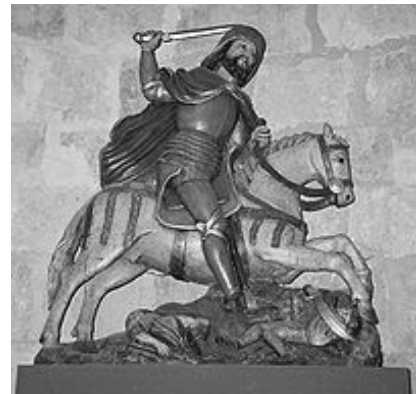
Santiago / San Séamas